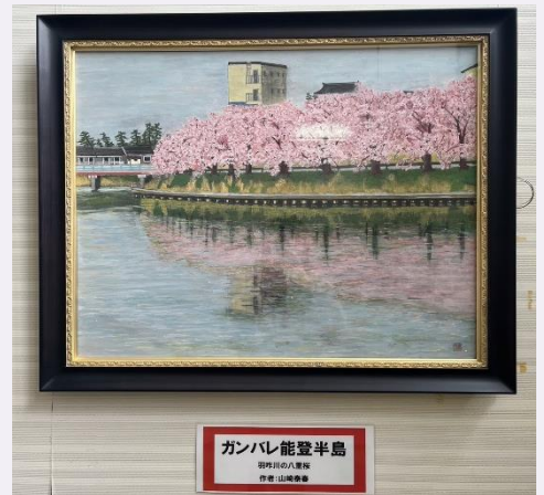
ガンバレ能登半島