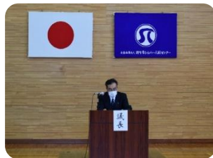
議長を務める日下副理事長